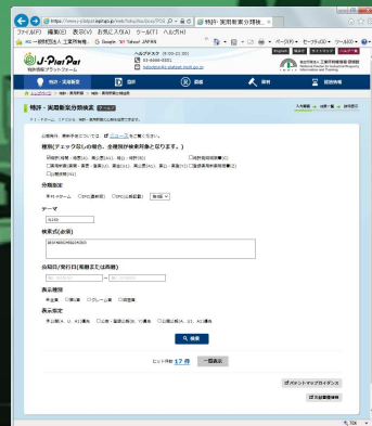
特許検索システムで最先端技術を検索・調査