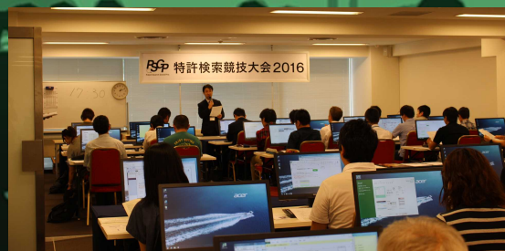
特許検索競技大会2016東京会場の様子